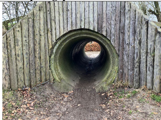
Redskab: Tunnel Årgang: Producent: Er redskabet mærket: Nej Er der registreret fejl/mangler: Ja