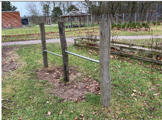
Redskab: Svingbom Årgang: Producent: Er redskabet mærket: Nej Er der registreret fejl/mangler: Ja