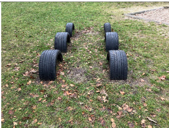
Redskab: Dæk leg Ikke omfattet af DE/EN 1176