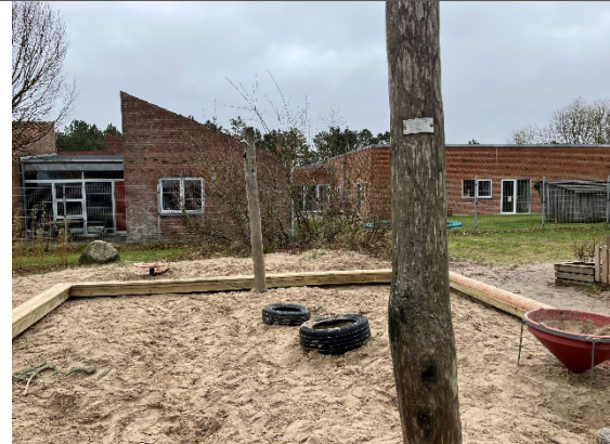
Redskab: Solsejlsstolper Årgang: 2017 Producent: JRJ Ribe Er redskabet mærket: Ja Er der registreret fejl/mangler: Nej