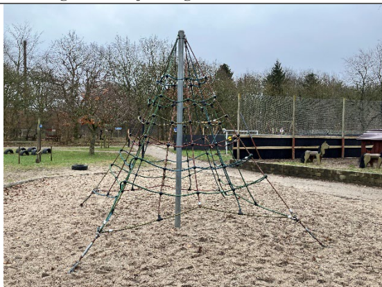
Redskab: 3D klatrenet Årgang: 2022 Producent: Rudeco Er redskabet mærket: Ja Er der registreret fejl/mangler: Nej