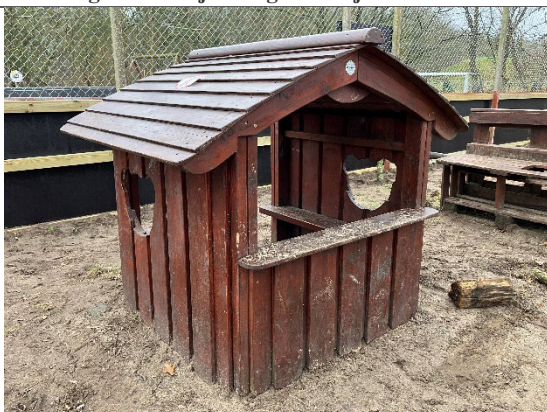
Redskab: Legehus Årgang: 2022 Producent: Guldborg Er redskabet mærket: Ja Er der registreret fejl/mangler: Nej