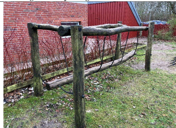
Redskab: Balance redskab Årgang: 2011 Producent: Rudco Er redskabet mærket: Ja Er der registreret fejl/mangler: Ja