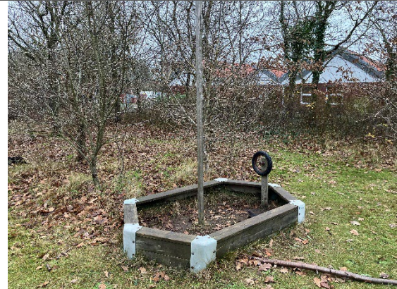
Redskab: Båd Årgang: Producent: Hørby bruk Er redskabet mærket: Ja men ulæselig Er der registreret fejl/mangler: Nej