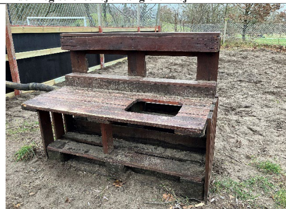
Redskab: Lege køkken Årgang: Producent: Er redskabet mærket: Nej Er der registreret fejl/mangler: Ja