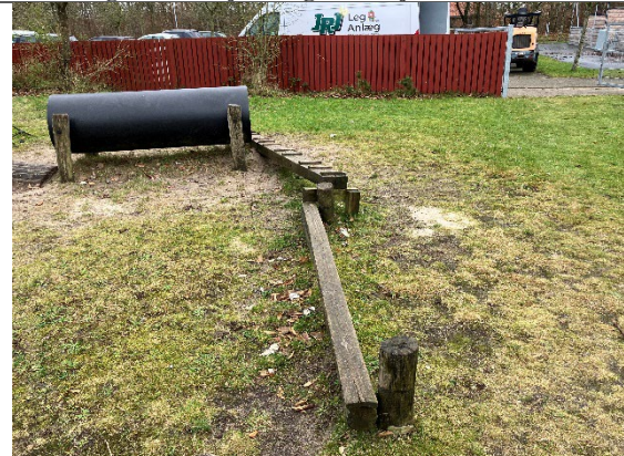
Redskab: Balance redskab Årgang: 2011 Producent: Cado Er redskabet mærket: Ja Er der registreret fejl/mangler: Ja