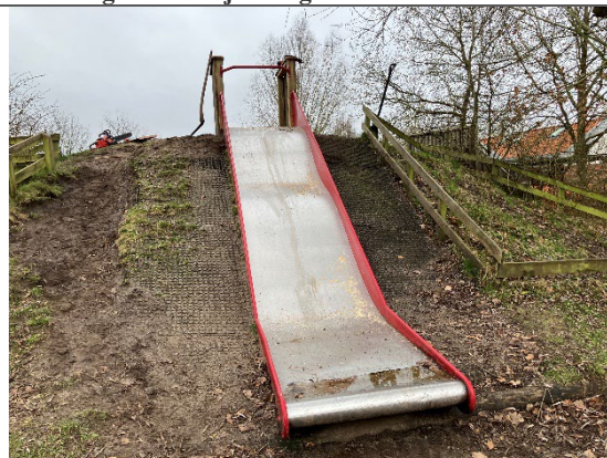
Redskab: Rutsjebane Årgang: Producent: Hags Er redskabet mærket: Ja men ulæselig Er der registreret fejl/mangler: Ja