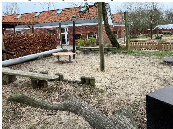
Redskab: Sandkasse / solsejlsplæle Årgang: 2017 Producent: JRJ Ribe Er redskabet mærket: Ja Er der registreret fejl/mangler: Nej