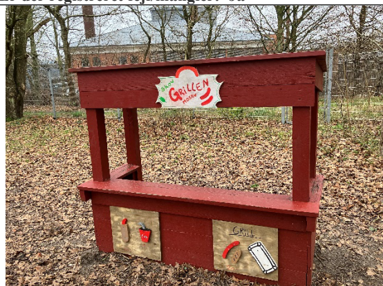
Redskab: Grillen Årgang: 2014 Producent: Egen produktion Er redskabet mærket: Ja Er der registreret fejl/mangler: Nej