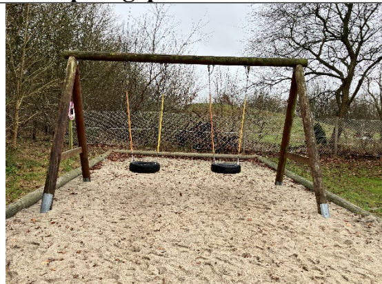
Redskab: Gyngestativ Årgang: 2014 Producent: Rejstrup savværk Er redskabet mærket: Ja Er der registreret fejl/mangler: Ja