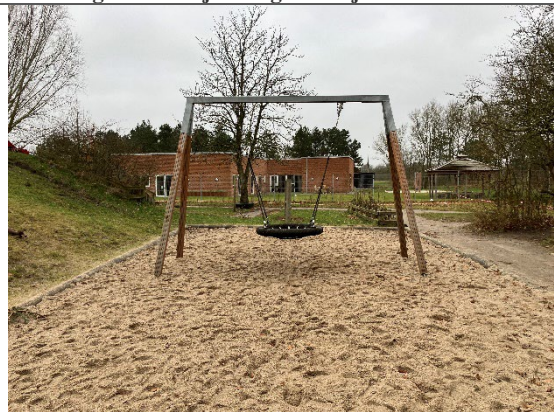
Redskab: Redegyng Årgang: 2022 Producent: Egen produktion Er redskabet mærket: Ja Er der registreret fejl/mangler: Nej