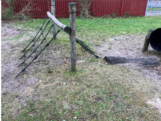
Redskab: Klatrenet Årgang: 2011 Producent: Cado Er redskabet mærket: Ja Er der registreret fejl/mangler: Ja