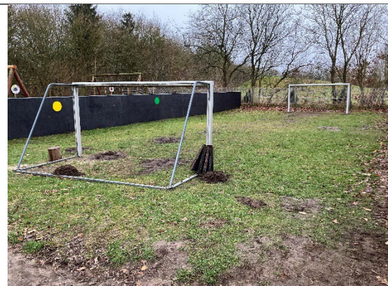
Redskab: Boldbane Ikke omfattet af DE/EN 1176