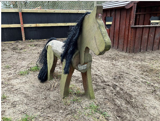
Redskab: Hest Årgang: 2021 Producent: Rudeco Er redskabet mærket: Ja Er der registreret fejl/mangler: Nej