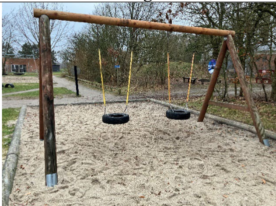
Redskab: Gyngestativ Årgang: 2014 Producent: Rejstrup savværk Er redskabet mærket: Ja Er der registreret fejl/mangler: Ja