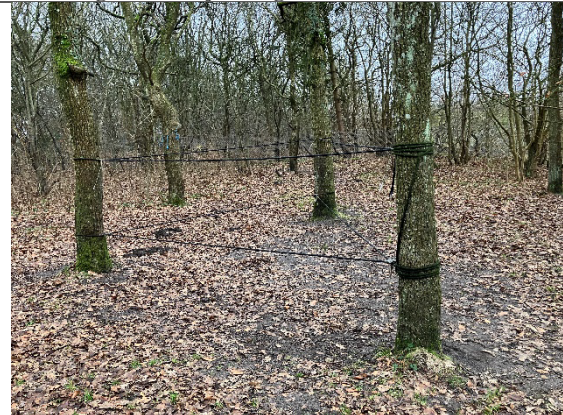
Redskab: Balanceredskab Ikke omfattet af DE/EN 1176