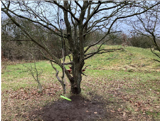
Redskab: Ulovlig gyng Ikke omfattet af DE/EN 1176