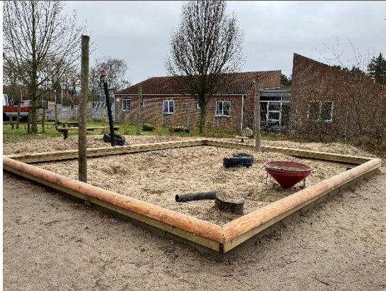
Redskab: Sandkasse Årgang: 2024 Producent: RJR Ribe Er redskabet mærket: Nej Er der registreret fejl/mangler: Nej