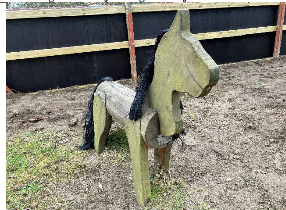
Redskab: Hest Årgang: 2021 Producent: Rudeco Er redskabet mærket: Ja Er der registreret fejl/mangler: Nej