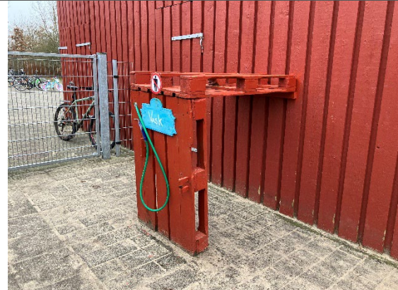
Redskab: Vaskehal Årgang: Producent: Er redskabet mærket: Nej Er der registreret fejl/mangler: Ja