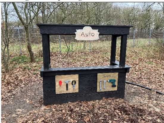
Redskab: Værksted Årgang: 2014 Producent: Egen produktion Er redskabet mærket: Ja Er der registreret fejl/mangler: Nej