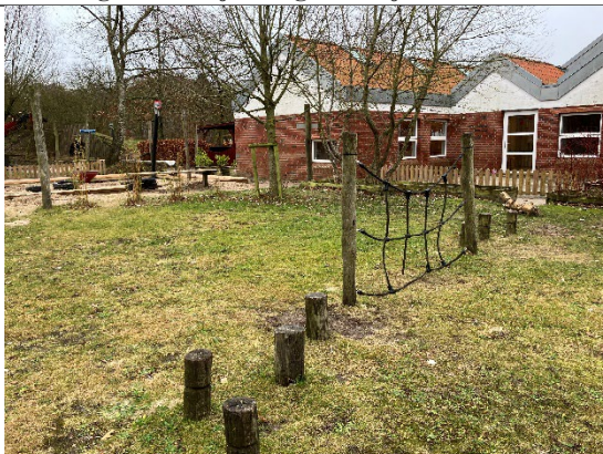
Redskab: Balance redskab Årgang: 2011 Producent: Cado Er redskabet mærket: Ja Er der registreret fejl/mangler: Ja