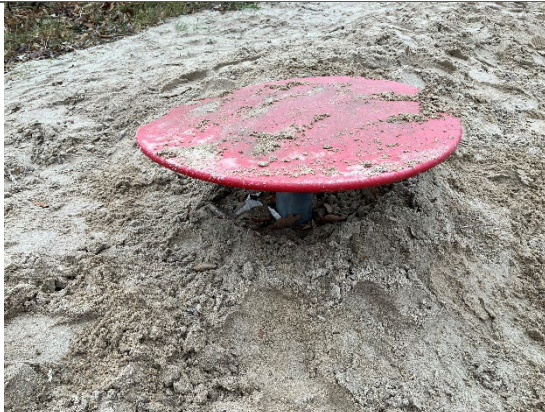
Redskab: Sandbord Årgang: 2016 Producent: Egen produktion Er redskabet mærket: Ja Er der registreret fejl/mangler: Nej