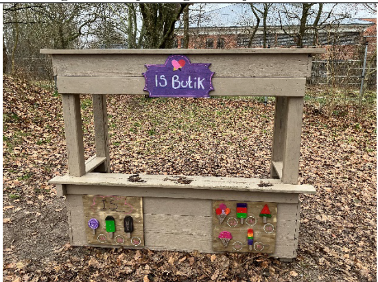
Redskab: Is butik Årgang: 2014 Producent: Egen produktion Er redskabet mærket: Ja Er der registreret fejl/mangler: Nej