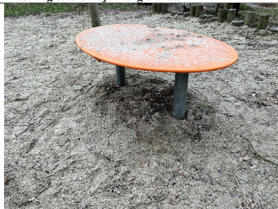
Redskab: Sandbord Årgang: 2016 Producent: Egen produktion Er redskabet mærket: Ja Er der registreret fejl/mangler: Nej