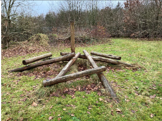
Redskab: Balancebom Årgang: 2021 Producent: Rudeco Er redskabet mærket: Ja Er der registreret fejl/mangler: Ja